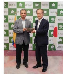
▲モンターニョ大使と前川区長

練馬区のプレスリリースにありますように、8 月 3 日 エクアドル大使が練馬区前川区長を表敬訪問され、その後当社ホテルにもお立ち寄りになりました。昨年の東京オリパラにおいて当社は練馬区のホストタウン事業に協力しエクアドルの選手・関係者が事前合宿で当社ホテルをご利用になったことから、私どもにも丁重な御礼のお言葉を頂戴いたしました。