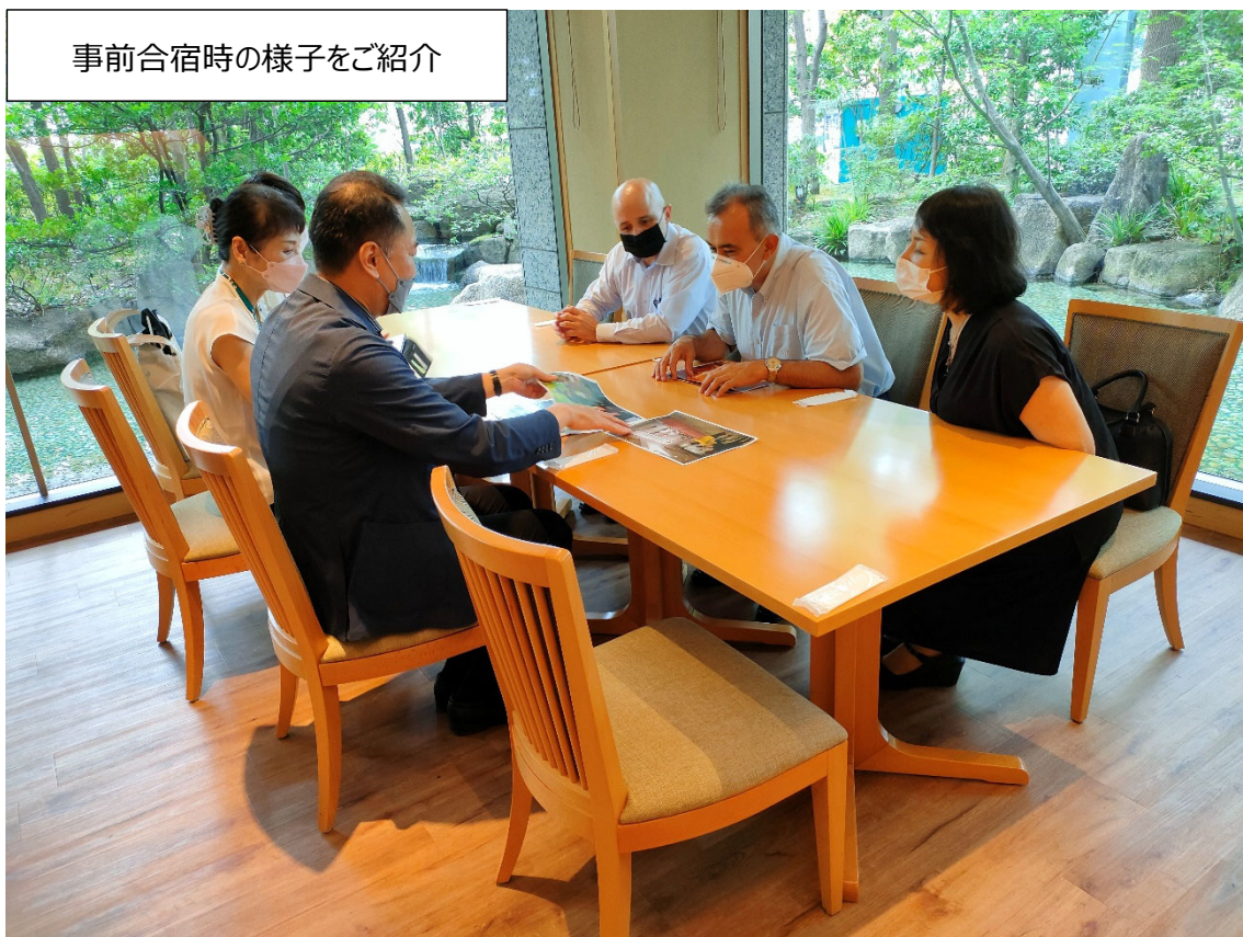
事前合宿時の様子をご紹介します